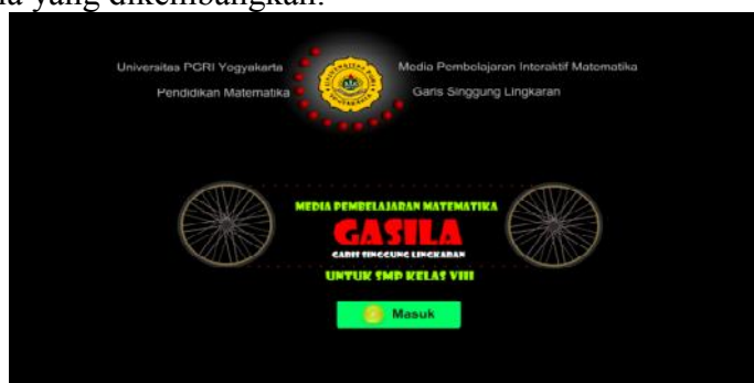
Gambar 4. Tampilan Intro

Penelitian ini menghasilkan suatu produk berupa media pembelajaran interaktif matematika berbasis masalah menggunakan Adobe Flash CS6 pada materi Garis Singgung Lingkaran untuk siswa SMP kelas VIII. Berikut beberapa tampilan media yang dikembangkan: