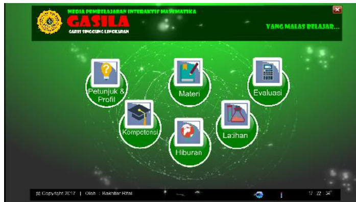
Gambar 5. Tampilan Menu Utama

Pada halaman menu utama ada tombol navigasi volume, sehingga siswa dapat menentukan tinggi rendahnya volume yang diinginkan. Halaman menu utama terdapat menu yang bisa dipilih oleh siswa, menu-menu tersebut yaitu 1. Petunjuk dan Profil; 2. Kompetensi; 3. Materi; 4. Latihan; 5. Evaluasi; 6. Hiburan.