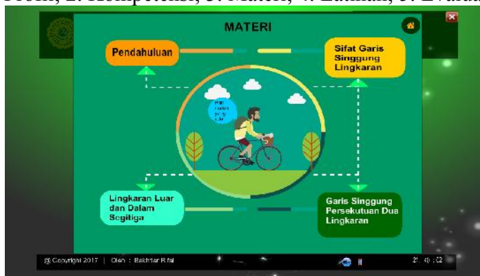
Gambar 9. Tampilan Menu Materi

Pada halaman menu utama ada tombol navigasi volume, sehingga siswa dapat menentukan tinggi rendahnya volume yang diinginkan. Halaman menu utama terdapat menu yang bisa dipilih oleh siswa, menu-menu tersebut yaitu 1. Petunjuk dan Profil; 2. Kompetensi; 3. Materi; 4. Latihan; 5. Evaluasi; 6. Hiburan.