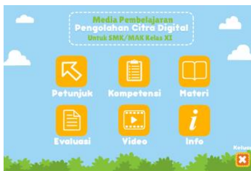
Gambar 3. Tampilan Menu Utama Menu Materi