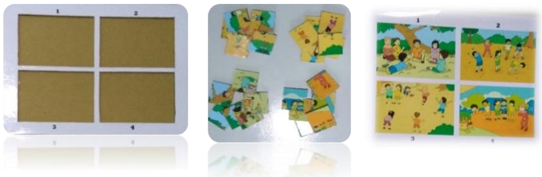
Gambar 1. Media Puzzle Gambar Seri

Model puzzle yang digunakan nantinya berupa puzzle dengan gambar seri yang dapat dilihat pada gambar 1 berikut: