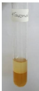
Gambar 1. Flavonoid

Sampel dalam tabung reaksi setelah dicampur dengan serbuk magnesium dan ditetesi asam klorida 2 N. kemudian campuran tersebut dipanaskan di atas penangas air selama 30 menit lalu disaring. Filtrat ditambahkan amil alkohol lalu dikocok kuat-kuat, hasilnya terbentuknya warna kuning hingga merah hal tersebut menunjukkan ekstrak kulit jeruk mengandung flavonoid. Dapat dilihat pada gambar 1.