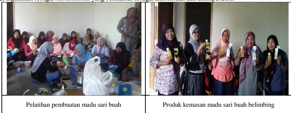
Pelatihan pembuatan madu sari buah

Pengembangan produk sari buah menjadi nutraceutical madu sari buah telah dilakukan dengan proses formulasi dengan penambahan madu dan sedikit propolis pada produk sari buah belimbing manis. Hasil pengembangan produk ini dapat digunakan sebagai nutraceutical yang berkhasiat sebagai antioksidan dan antihipertensi.