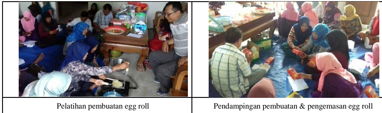
Gambar 3. Pelatihan pembuatan dan pengemasan egg roll dari buah belimbing

Produk egg roll , menggunakan bahan dasar yang mudah ditemukan, dengan harga yang murah dan hasilnya lebih banyak. Fleksibilitas dalam pembuatan egg roll lebih luas, terutama dalam menentukan tingkat keenceran adonannya. Baik adonannya yang agak encer maupun yang lebih kental, dapat dibuat menjadi egg roll dengan citarasa yang disukai.