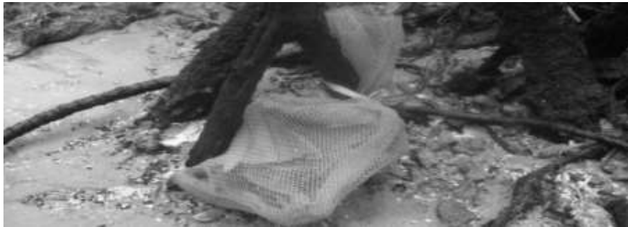
Gambar 2. Litter-Bag (kantong serasah)

Litter-Trap adalah alat atau wadah untuk menangkap/menampung guguran serasah dari pohon Mangrove, dalam penelitian ini Litter-Trap berbentuk persegi empat terbuat dari jaring berbahan nilon ukuran 1 \times 1 \text{ m}^2 dengan mesh size 0,5 cm, dilengkapi dengan tali pengikat disetiap sudutnya dan pemberat dari batu ditengahnya. Sedangkan Litter-Bag adalah alat atau wadah bagi sampel dekomposisi daun mangrove, terbuat dari jaring berukuran 10 \times 20 \text{ cm} dengan mesh size 0,5 cm yang diikatkan pada akar mangrove dilantai hutan.