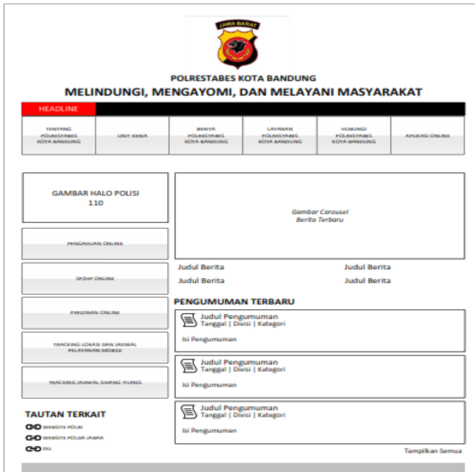
Gambar 2. desain menu tentang

Dilihat dari desain map keseluruhan yang ada pada gambar 4.1, menunjukkan bahwa terdapat enam menu utama yang mewakili semua unit kerja yang ada di Mapolresta Bandung.