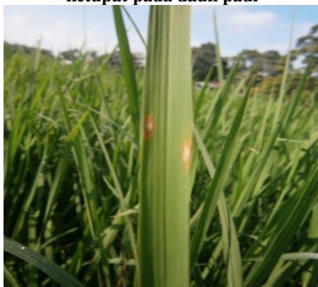
Gambar 1. Gejala bercak coklat belah ketupat pada daun padi

Bercak pada daun mempunyai ciri khas berbentuk elips atau belah ketupat. Bagian tengah bercak berwarna kelabu atau keputihan, dan bagian tepi biasanya coklat atau merah kecoklatan. Bentuk dan warna bercak tergantung pada kondisi lingkungan, umur bercak, dan kepekaan tanaman padi. Reaksi ketahanan varietas ditunjukkan dari warna gejala pada daun, masing-masing adalah bercak coklat kecil menunjukkan reaksi tahan, coklat kekuningan reaksi ketahanan moderat, coklat kelabu kekuningan reaksi peka, dan abu abu keputihan sangat peka. Gejala awal dimulai dari bercak kecil berwarna coklat, keputihan, akan berkembang dengan cepat pada kondisi kelembaban tinggi dan varietas yang peka. Bercak dapat berkembang sampai ukuran panjang 1 – 1,5 cm dan lebar 0,3 - 0,5 cm, biasanya tepi bercak berwarna coklat. Bercak yang banyak pada daun dapat mengakibatkan kematian tanaman, yang diikuti dengan pengeringan pelepah. Bibit yang terinfeksi berat atau tanaman pada stadia pertumbuhan akan dapat mengering dan mati, di lapang. Intensitas serangan yang tinggi pada bercak daun di saat pertumbuhan vegetatif akan dapat mengakibatkan kekerdilan. Gejala pada leher malai ditunjukkan dengan warna coklat keabuan pada pangkal leher malai, daerah dekat leher malai berwarna coklat dan semua cabang dan ranting menunjukkan gejala pengeringan. Infeksi pada leher malai akan mengakibatkan mudah patahnya leher malai yang akan mengakibatkan terganggunya pengisian malai (Ou, 1985).