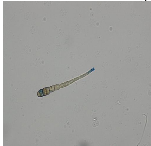
Gambar 6. Konidia Jamur Alternaria sp

Jamur Alternaria sp merupakan penyebab penyakit Stacburn. Adapun gejala serangan penyakit ini adalah pada daun terdapat bercak besar, jorong atau bulat, dengan tepi coklat, sempit dan jelas yang melingkari bercak seperti cincin. Pusat bercak semula berwarna coklat pucat, sedikit demi sedikit menjadi hamper putih sama sekali, dengan banyak titik-titik hitam yang terdiri dari sklerotium jamur (Semangun, 1993).