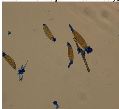
Gambar 4. Konidia jamur Drechslera oryzae

Menurut Ou (1985), konidia bentuknya sedikit melegkung (kurva), membesar dibagian tengah dengan ukuran 35 - 170 x 11 – 17 µm, jumlah septa mencapai 13 (Ou, 1985). Konidia yang telah masak tumbuh pada kedua ujung konidia. Jamur patogen penyakit bercak coklat adalah Cochliobolus miyabeanus . ( Drechslera oryzae sp).