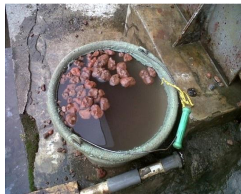
Uji apung dengan air