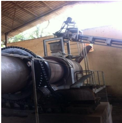
Tungku bakar putar ( rotary kiln )