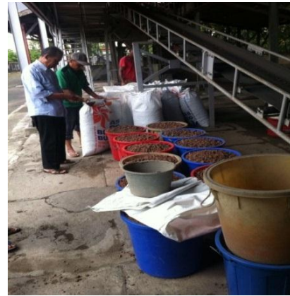
Pemeriksaan agregat secara visual