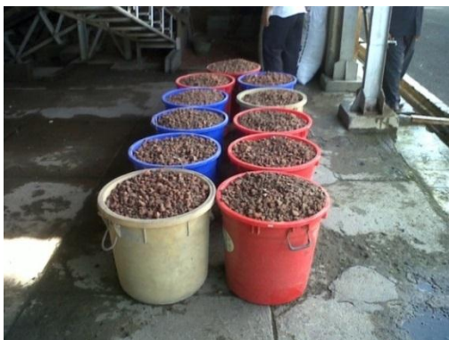
Penyimpanan dalam wadah