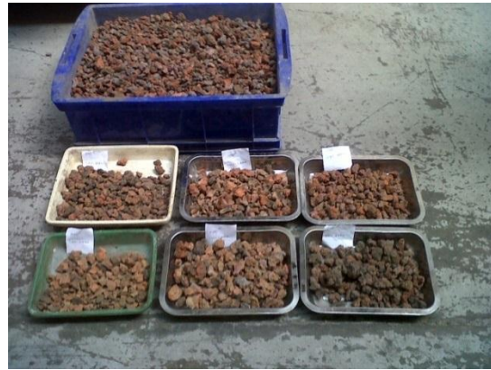
Hasil uji bakar dengan berbagai suhu

Dari uji bakar dengan suhu bervariasi antara 800 °C sampai dengan 1100 °C, berdasarkan pengamatan visual diperoleh hasil: