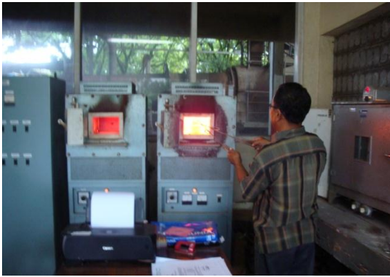
Uji bakar dengan tungku pijar Gambar 1. Uji coba pembakaran agregat ringan