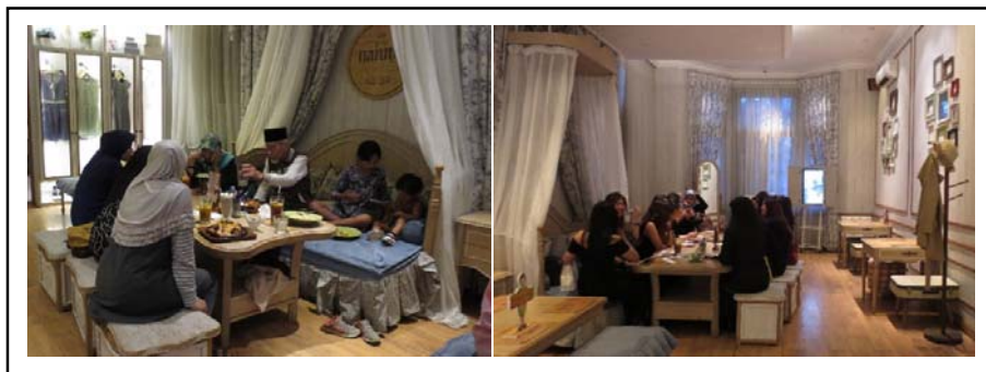
Gambar 1. Kelompok pengunjung dengan berbagai aktivitas di Nanny's Pavillon.

Suasana rumah sendiri di hadirkan untuk memperkuat konsep kafe ini. Hal ini dapat di lihat ketika awal memasuki kafe, dari segi arsitektur bangunan di rancang seperti sebuah rumah dengan pepohonan dan halaman yang luas pada bagian depan dan belakang rumah. Sementara dari segi desain interior terlihat dari pemilihan warna ruang yang diterapkan, yaitu menggunakan warna-warna lembut seperti coklat, biru, hijau tua, dan warna-warna lain yang dapat meningkatkan kenyamanan psikologis pengunjung. Sementara untuk elemen dekoratif beberapa sudut ruang di letakkan lemari pakaian, kaca rias, mesin jahit, lampu meja, hingga perlengkapan mandi yang bertujuan agar pengunjung benar-benar merasakan kenyamanan layaknya di rumah sendiri. Nanny's Pavillon sendiri dapat menampung pengunjung hingga sekitar 150 orang. Sementara untuk pilihan menu, Nanny's Pavillon menyediakan western food dengan pancakes sebagai menu utama. Pilihan menu di kafe ini mulai dari harga Rp10.000 – Rp 180.000. Berikut denah dan kondisi eksisting dari Nanny's Pavillon.