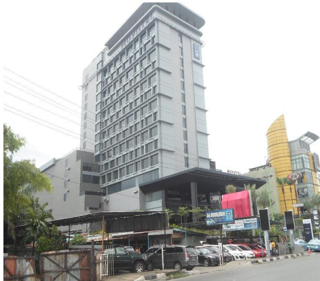
Gambar 2. Tampak Depan Hotel Novotel