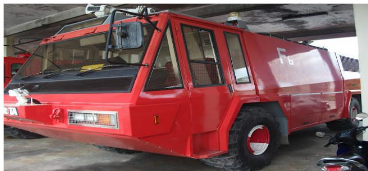
Gambar-1. Kendaraan Foam Tender F6 Morita, tahun pengadaan 1994