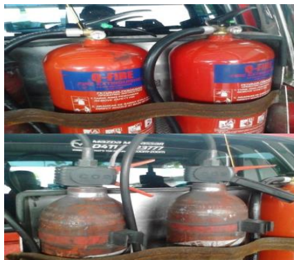
Gambar-2. Pemadam Portable CO