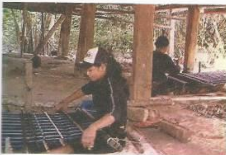
Foto No. 1. Tempat menenun dan menernak babi di bawah bangunan

Merupakan ruangan bagian bawah, sebatas lantai ke bawah yang berfungsi sebagai penyimpanan hasil panen. Di samping itu di bawah kolong rumah dapat dipergunakan pula sebagai tempat menyimpan alat-alat pertanian. Pada bagian bawah