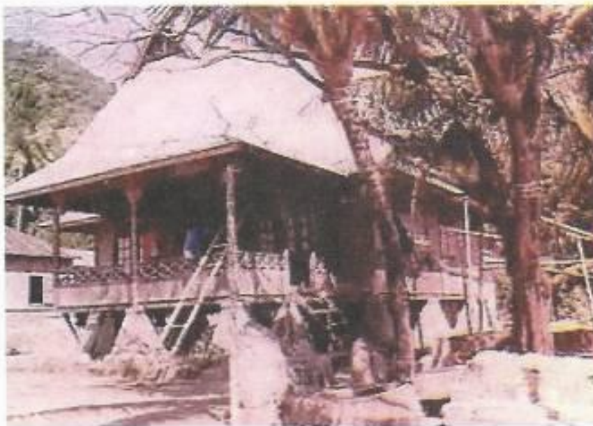
Foto No. 2. Rumah adat Lepo pandangan depan