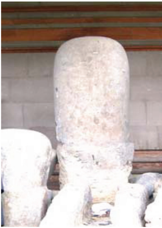
Foto 6. Lingga di Pura Gelang Agung

Lingga pada awalnya dipercaya sebagai kelanjutan dari bangunan tradisi prasejarah yaitu