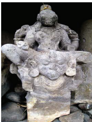
Foto 1. Arca garuda wisnu di pura gelang agung.

Deskripsi arca Garuda Wisnu yang terdapat di pura Gelang Agung ini, dapat diuraikan sebagai