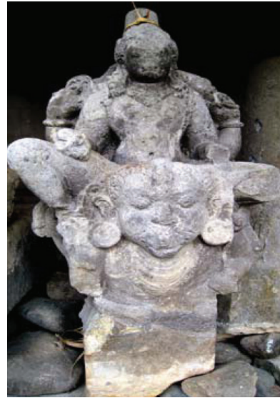
Foto 8. Garuda Wisnu Buangga, Bali