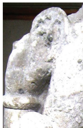
Foto 2. Cakra pada tangan kanan belakang

Perhiasan yang dipergunakan dapat disebutkan berupa arca memakai mahkota yang bentuknya kemungkinan berupa jatamakuta , terlihat berupa bulatan rata dan memiliki ujung datar memiliki jamang tetapi ukirannya sudah sangat aus, sehingga sulit diidentifikasi. Bentuk muka lonjong, dengan mata terbuka, alis aus, hidung dan mulut juga sudah aus. Arca memakai anting-anting yang mengelantung hingga dipundak dengan bentuk lingkaran untaian ratna yang bersusunan. Memakai kalung yang berbentuk segitiga dari untaian mutiara yang bersusun, tidak terlihat adanya tali perut ( udhara bandha ), tetapi memiliki kelat bahu ( upavita ) dari pundak kiri hingga paha kanan. Gelang lengan berupa tali untaian mutiara dengan hiasan berbentuk simbar belah ketupat dan gelang tangan berbentuk lingkaran. Kain yang dipergunakan kurang jelas bentuk dan motifnya.