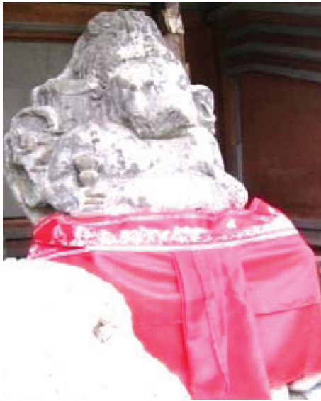
Foto 5. Arca Ganesa Pura Gelang Agung

taring dan tangan kiri depan memegang mangkok. Perawakan tambun dengan perut buncit. Gelang lengan berbentuk sulur segi tiga; gelang tangan berbentuk bulatan. Tinggi arca keseluruhan 90 cm, tinggi arca 57 cm, tinggi lapik 29 cm, lebar arca 40 cm.