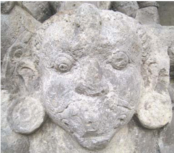
Foto 4. Muka arca garuda

Dari keseluruhan penampilan arca Garuda Wisnu di Pura Gelang Agung ini, ada beberapa hal yang perlu kita perhatikan dengan seksama, terkait dengan sikap dan atribut yang dibawa oleh arca tersebut. Atribut kedewaan adalah cakra di tangan kanan belakang dan sangkha di tangan kiri belakang,