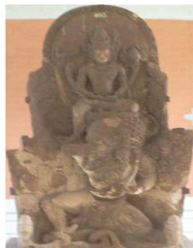
Foto 9. Garuda Wisnu, Belahan, Jawa Timur.