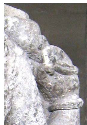
Foto 3. Sangkha pada tangan kiri belakang