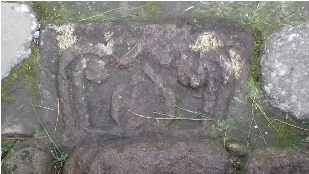
Gambar 3. Untaian garis melengkung menyerupai mahkota.

kini sudah tidak terlihat lagi, kemungkinan sudah terpendam oleh tanah. Pada teras kedua dibatasi talud berupa batu gundul di sisi utara dan barat, sedangkan sisi selatan berupa tatanan batu alam berukuran cukup besar. Panjang halaman kurang lebih 70 meter dan teras ini berbentuk trapezium. Di tengah talud terdapat tangga naik, tangga paling bawah bagian atas terdapat relief. Terlihat untaian garis melengkung ke dalam pada kedua sisi dan terbingkai oleh garis yang bertemu menyerupai mahkota (gambar 3).