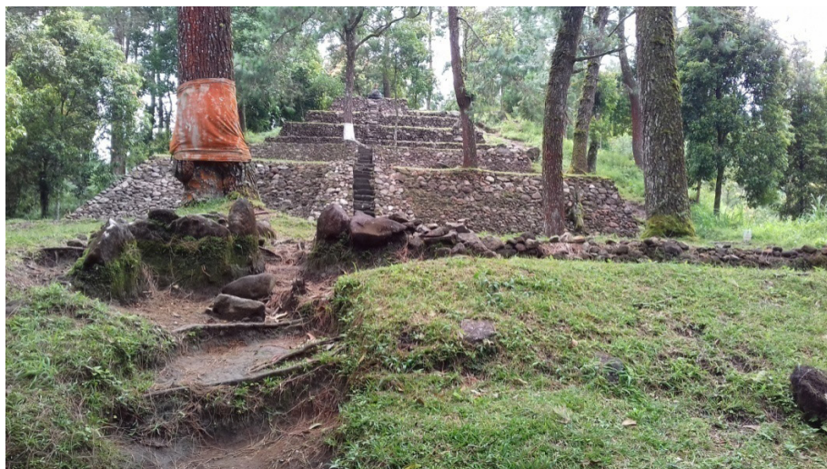
Gambar 2. Candi Kethek.

Candi Kethek merupakan bangunan berteras empat yang tersusun oleh batuan andesit dan masing-masing teras dihubungkan dengan anak tangga (gambar 2). Teras pertama mempunyai panjang halaman kurang lebih 100 meter. Pada sisi timur laut terdapat struktur bangunan. Berdasarkan hasil ekskavasi tahun 2005 pada teras ini terdapat arca kura-kura yang