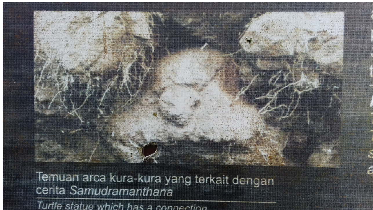
Gambar 4. Arca Kura-kura.

Arca kura-kura merupakan data yang penting untuk merekonstruksi latar belakang agama Candi Kethek. Kura-kura dalam Agama Hindu merupakan salah satu avatara Wisnu. Sering disebut dengan Kurma Avatara . Di dalam beberapa kesusastaan dikenal bermacam-macam avatara Wisnu, diantaranya yang terkenal ada sepuluh yang lebih dikenal dengan dasavatara Wisnu. Tercantum dalam kitab Varaha Purana. Sebaliknya dalam kitab Bhagavata Purana disebutkan sebanyak dua puluh dua avatara . Menurut kepercayaan Hindu India, dasavatara dianggap berhubungan dengan sepuluh macam kejadian di dunia, ketika Wisnu bertugas menghancurkan berbagai rintangan yang menghalangi perputaran dunia. Kesepuluh avatara Wisnu menurut Varaha Purana adalah