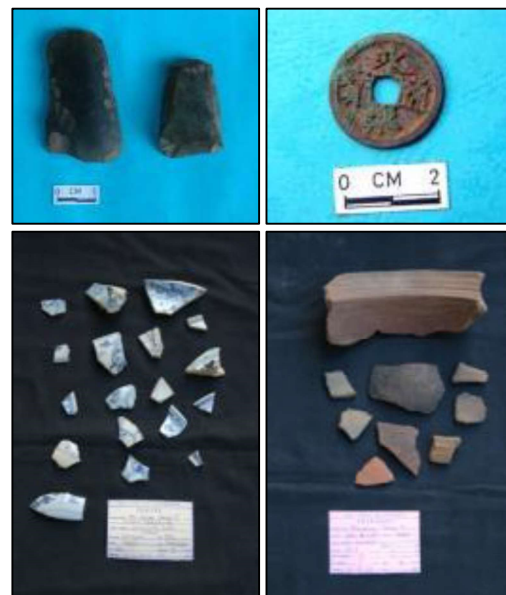
Gambar 3. Dari Kiri ke kanan: Beliang persegi, uang kepeng (atas), fragmen keramik asing dan tembikar hasil survei permukaan di kawasan ranu Segaran (bawah).