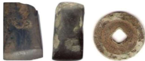
Gambar 2. Dari Kiri ke kanan: Beliang persegi patah pada bagian pangkal, beliang utuh terdapat retus pada bagian tajam, uang kepeng temuan survei permukaan.

narasumber yang mengatakan bahwa penebangan hutan atau illegal logging di wilayah ini mulai dirasakan sejak masa orde lama tahun 1960-an yang dipelopori oleh Barisan Tani Indonesia (BTI). Sejak saat itu kearifan lokal masyarakat tentang pelestarian hutan mulai menipis. Informasi ini diperoleh dari wawancara pribadi dengan Bapak Sumindar (65 th), mantan Kepala Sekolah SD Negeri I Ranu Gedang Tgl. 7 April 2008 (Gunadi 2008, 34).