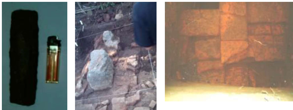
Gambar 1. Dari kiri ke kanan: bakalan beliung persegi, ekskavasi Temugelang , temuan struktur pondasi candi bata.