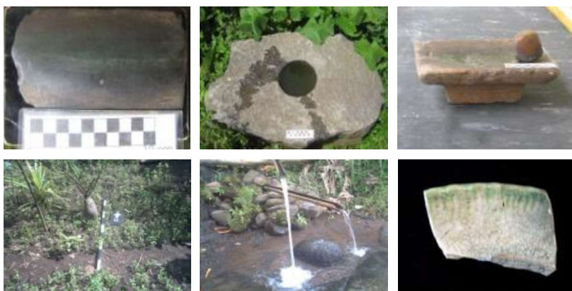
Gambar 4. Fragmen beliung persegi, lumpang batu, batu pipisan. (atas dari kiri ke kanan). Nisan makam cikal, salah satu sumber air bersih, fragmen keramik Tang hasil ekskavasi test pit. (bawah dari kiri ke kanan).

berada pada lahan yang relatif datar apabila dibandingkan dengan lokasi lain. Lokasi yang sekarang merupakan Dusun Krajan bagian Barat selain banyak ditemukan artefak prasejarah seperti beliung persegi ( gigi kelap ), ditemukan pula beberapa sumber mata air, dan kubur cikal bakal Desa Segaran, yang semuanya merupakan indikator dari suatu permukiman. Data lain seperti pemanfaatan baik ranu maupun sumber mata air oleh masyarakat yang bermukim di sekitar ranu hingga sekarang ini, dapat dijadikan acuan sebagai gambaran kehidupan masyarakat masa lampau yang hidup di sekitar danau tersebut sebab sumberdaya alam tersebut merupakan data yang bersifat dependable sehingga dapat dijadikan sebagai data analogi etnografi (Gunadi 2009, 21--29).