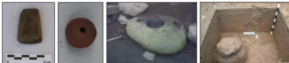
Gambar 5. Dari kiri ke kanan: beliung persegi, manik-manik terakota, lumpang batu 3 lubang, fitur tanah keras bekas perapian, kotak ekskavasi TP IV.

Dari hasil survei geologi penelitian permukiman masa lampau di tepian danau kali ini juga menemukan jenis batuan gneiss yang secara fisik (kasat mata) mirip dengan beliung persegi. Untuk memastikan apakah bahan baku beliung persegi tersebut ditemukan di kawasan penelitian, perlu dilakukan analisis petrografi baik sampel batuan gneiss maupun sampel yang diambil dari beliung persegi. Hasil analisis petrografis yang dilakukan oleh Laboratorium Petrografi Jurusan Teknik Geologi, Fakultas Teknologi Mineral, Universitas Pembangunan Nasional (UPN) “Veteran”, Yogyakarta, menyatakan bahwa kandungan mineral utama antara beliung persegi dan batuan gneiss tersebut berbeda, sehingga dapat disimpulkan bahwa temuan beliung persegi di kawasan ranu-ranu diperkirakan berasal dari daerah lain karena bahan baku batuan tidak ditemukan di lokasi penelitian. Sedangkan hasil analisis petrografi sampel tembikar