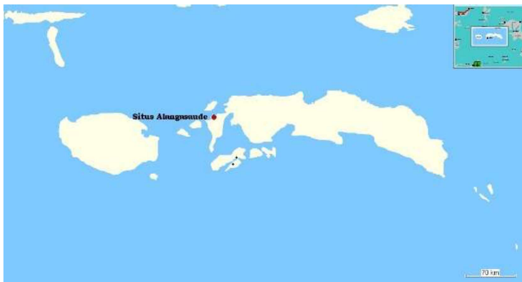
Gambar 1. Lokasi penelitian

Secara umum iklim di Maluku adalah tropis. Musim kemarau jatuh pada Bulan Oktober hingga Maret. Pada saat itu angin bertiup dari arah barat laut, barat daya dan dari arah utara pada saat pergantian musim. Musim hujan jatuh pada