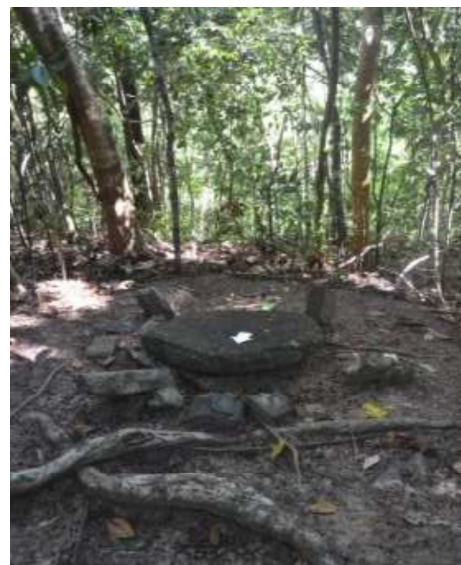
Gambar 3. Batu Dulang 2

arah laut ataupun arah gunung). Kaki yang patah dan rebah dibiarkan penduduk begitu saja, dikarenakan pemahaman mereka yang menganggap benda tersebut keramat dan pamali untuk mengubah bentuk ataupun menggeser dan mengangkatnya. Walaupun pada akhirnya tim penelitian juga harus meminta izin dari tetua adat yang menemani tim ke lokasi untuk memegang dan mengukur dimensional batu tersebut.