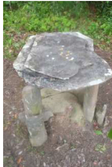
Gambar 2. Batu Dulang 1 dengan koin di atasnya

Bulan Maret sampai dengan Oktober. Hal ini menjadi sebuah catatan tersendiri, di mana batuan batu dulang memiliki tingkat keausan yang tinggi karena berada di lahan terbuka serta terpapar tingkat kelembaban hujan dan terik matahari yang intens.