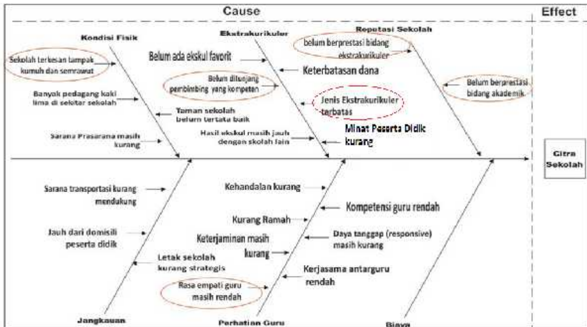
Gambar 3 Analisis Fishbone hasil FGD Membangun Citra ( Image ) Sekolah

membangun citra sekolah diperoleh hasil seperti pada diagram fishbone dalam Gambar 3 berikut.