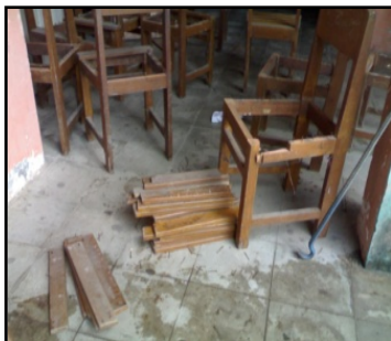
Gambar 2. Tumpukan Kayu bekas kursi, meja, dll

Tumpukan kayu bekas ini telah menginspirasi penulis sehingga tercipta satu unit melodi musik kolintang melalui program pengabdian kepada masyarakat, memberi penegasan bahwa sesuatu yang sudah terkategori limbah sekalipun, jika dikreasi secara positif akan dapat memberi manfaat yang besar dan luar biasa.