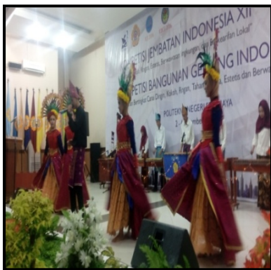
Gambar 5. Perform dalam Beberapa Kegiatan Mahasiswa Berskala Nasional

Pada awal karyanya (Mandiangan, et al., 2011: 1-3) mengutarakan manfaat yang dapat dinikmati dari kehadiran musik kolintang di Politeknik Negeri Sriwijaya antara lain: "... ada beberapa kenyataan yang patut dikaji dan dieksploitasi guna dijadikan karya pengabdian yang memiliki manfaat bagi orang lain dan banyak pihak (stake holder).... ". Lebih lanjut ia berharap bahwa "...juga mahasiswa dalam program ekstra kurikuler. Bahkan berpotensi besar untuk dijadikan usaha kegiatan bisnis mahasiswa mengisi waktu luang mereka.". "Mimpi" itupun mulai mewujudkan realitasnya, ketika saat mahasiswa UKM Seni Polsri dihampiri