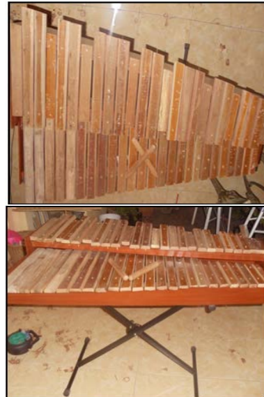
Gambar 3. Melodi musik Kolintang dari Kayu Bekas Kursi

Tumpukan kayu bekas ini telah menginspirasi penulis sehingga tercipta satu unit melodi musik kolintang melalui program pengabdian kepada masyarakat, memberi penegasan bahwa sesuatu yang sudah terkategori limbah sekalipun, jika dikreasi secara positif akan dapat memberi manfaat yang besar dan luar biasa.