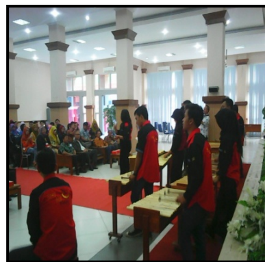
Gambar 6. Perform untuk Kegiatan Lembaga

Dokumen kegiatan mahasiswa di atas membuktikan bahwa musik kolintang berkontribusi dalam menyalurkan kreativitas berkesenian mahasiswa, berfungsi sebagai sarana pembinaan soft skill mereka.