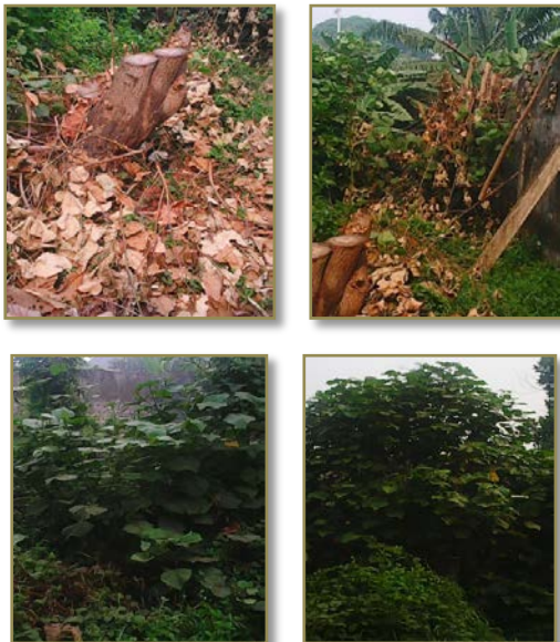
Gambar 1. Pohon Waru di Kampus Polsri

hasilnya, secara keseluruhan dilakukan di dalam kampus Politeknik Negeri Sriwijaya sangatlah mungkin dan realistis. Mengingat, kenyataan bahwa Politeknik Negeri Sriwijaya pernah menerima skema bantuan penghijauan lahan kampus dari pemerintah pada tahun 2012, yang kemudian diaplikasikan dengan menanam seribu pohon jati. Bila disimak hingga tahun ini (2016), nampaknya program tersebut hanya untuk fungsi penghijauan semata, tanpa pemberdayaan yang keberlanjutan. Sementara itu dalam pengamatan penulis bahwa pohon waru yang tak kalah berfungsi sebagai pohon penghijauan, pertumbuhannya sangat cepat dan subur sekali. Boleh dikatakan tidak pernah dipelihara bahkan diupayakan untuk dimusnakan dengan cara ditebang dan dibakar, namun pohon ini terus bertunas dan tumbuh kembali.