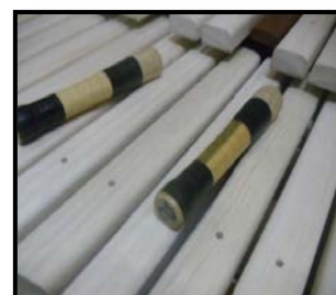
Gambar 7. Kayu Waru Bahan Baku Musik Kolintang, 2015