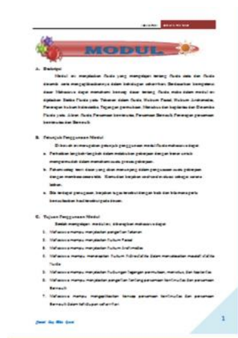
Gambar 2 Rancangan deskripsi, petunjuk dan penggunaan modul

Modul berisi petunjuk belajar , kompetensi yang akan dicapai, isi materi, informasi pendukung, evaluasi yang dikaitkan dengan komponen inkuiri yaitu merumuskan masalah, merumuskan hipotesis, mengumpulkan data, dan membuat kesimpulan.