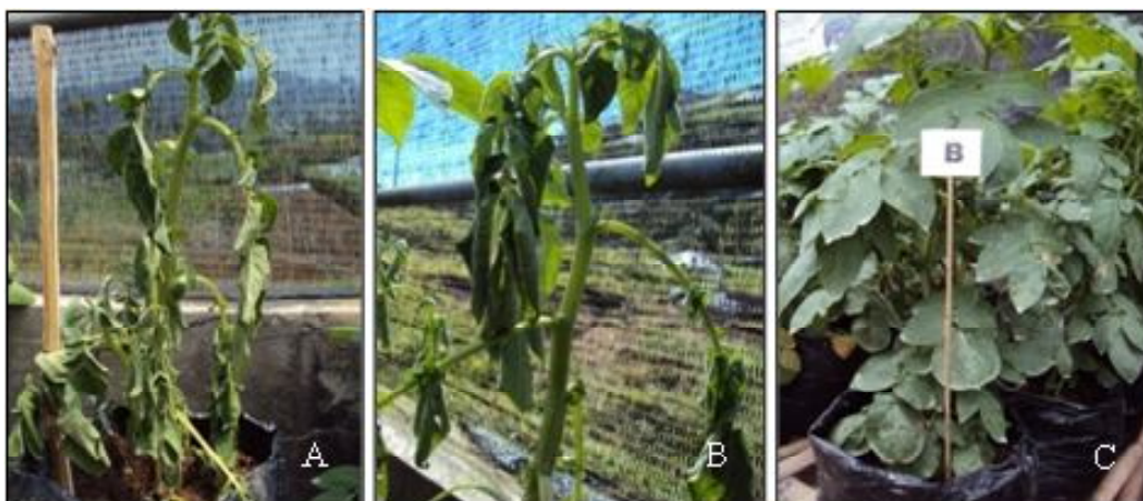
Gambar 2. Gejala layu bakteri pada kontrol (A), perlakuan mutan Bacillus sp. B315M16 (B) dan tanaman sehat pada perlakuan Bacillus sp. B315 tipe alami