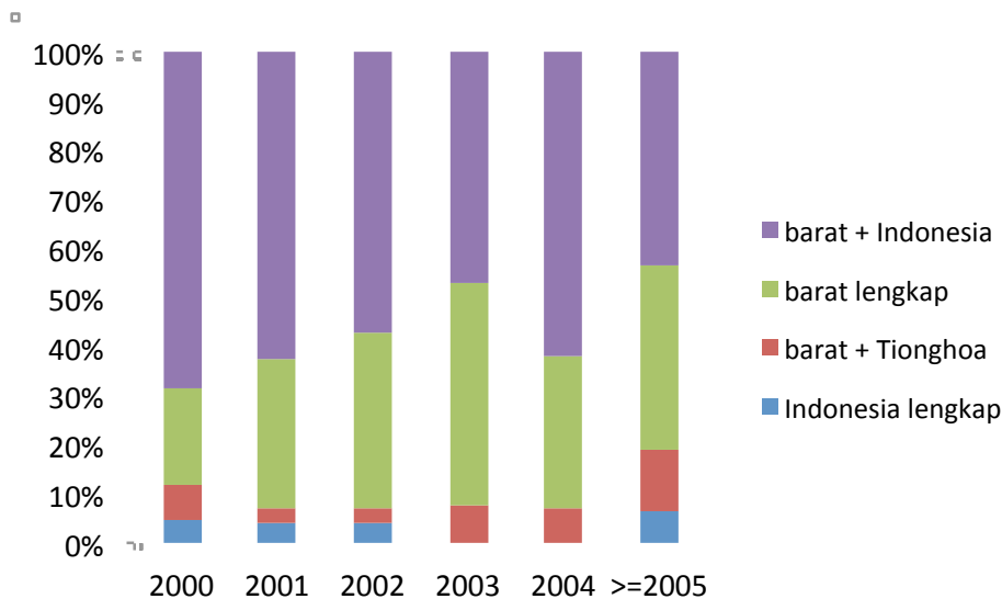
Gambar 3. Diagram Frekuensi Penggunaan Nama per Tahun Lahir

Dengan demikian dari dua diagram ini bisa diketahui bahwa, ada 66% yang namanya sama sekali tidak mengandung unsur Tionghoa. Bila dibandingkan dengan penelitian Irzanti Sutanto (2004), maka terdapat perbedaan yang cukup signifikan, 66% dibandingkan 43%.