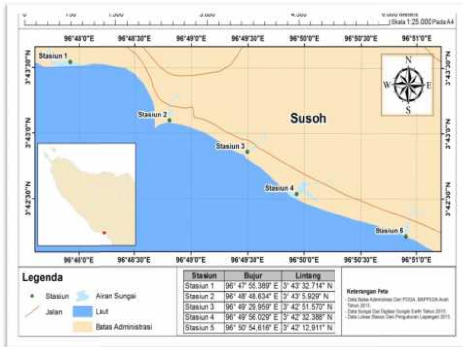
Gambar 1. Peta lokasi penelitian di Kecamatan Susoh

Penentuan lokasi pengambilan sampel dilakukan dengan metode purposive sampling yaitu berdasarkan pertimbangan tertentu atas keberadaan sampel di lokasi penelitian. Lokasi pengambilan sampel terdiri dari 5 stasiun yaitu stasiun 1 di muara sungai Desa Pulau Kayu, stasiun 2 di muara sungai Desa Kedai Susoh, stasiun 3 di muara sungai Desa Palak Kerambil, stasiun 4 di muara sungai Desa Sangkalan, dan stasiun 5 di muara sungai Desa Rubek Meupayong.