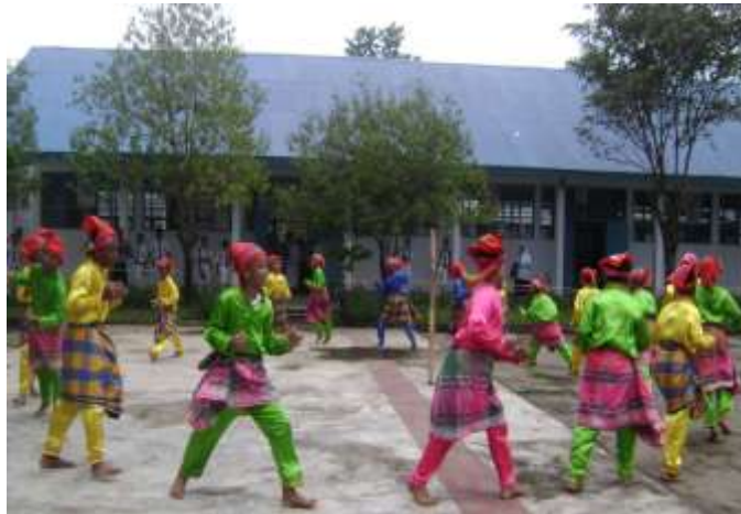
Gambar 2. Gerak Ma'Rencong-rencong

Model Pengembangan Gandang Bulo sebagai Bahan Ajar Seni Budaya . Model pembelajaran menggunakan pendekatan kontekstual. Konsep belajar ini fokus pada aktivitas siswa belajar secara bersama dalam