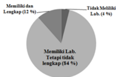
Gambar 1. Keadaan fasilitas laboratorium di SLTA Kab. Lombok Timur

masing sekolah memiliki kemampuan berbeda-beda dalam menyediakan sarana dan prasarana eksperimen di laboratorium fisika. Berdasarkan hasil survei, diketahui bahwa dalam proses pembelajaran fisika di SLTA kabupaten Lombok Timur, 80% dari guru-guru mengalami kendala pada sebagian materi, sedangkan 20% guru mengalami kendala disemua materi. Kendala tersebut terkait dengan tidak tersedianya laboratorium penunjang yang memadai di sekolah. Dari semua guru dalam anggota MGMP, diketahui hanya ada 12% guru menyatakan sekolahnya memiliki sarana laboratorium yang lengkap sementara terdapat 4% guru menyatakan sekolahnya sama sekali tidak memiliki sarana laboratorium.