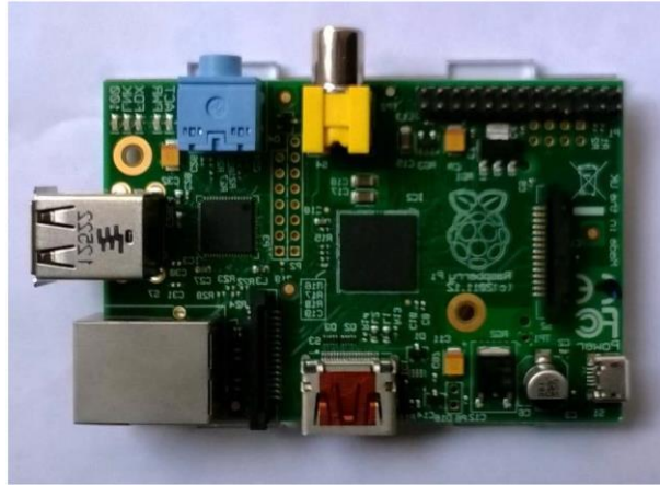
Gambar 2. Single board computer.

Mengendalikan perangkat listrik dengan single board computer tentunya memerlukan aplikasi dan perangkat keras pendukung lainnya. Terdapat beberapa aplikasi pendukung seperti: aplikasi antarmuka, konfigurasi, dan aplikasi pengendali. Sedangkan untuk perangkat keras pendukung menggunakan relay board . Arsitektur dari sistem yang dibuat ditunjukkan pada Gambar 3.