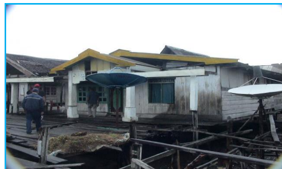
Gambar 3. Pemukiman Dikali Kota Kendari

Walaupun ada empat komponen yang ditawarkan dalam analisis struktural perumahan kumuh, namun dalam tinjauan ini penekanan akan diarahkan lebih besar ke komponen budaya, karena menurut persepsi penulis lebih tepat untuk materi matrikulasi Program Magister Kajian Budaya. Walau demikian, komponen lain akan tetap diberi porsi sewajarnya. Komponen budaya yang dimaksud di sini adalah adanya masalah Budaya Kemiskinan yang menyebabkan lemahnya Modal Sosial untuk pembangunan.