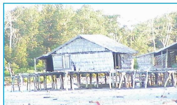
Gambar 2. Pemukiman Terpinggirkan Masyarakat Pesisir Toronipa Kota Kendari

Di dalam upaya pembangunan untuk meningkatkan derajat kehidupan yang lebih baik bagi kelompok sosial masyarakat di permukiman terpinggirkan ini, pihak perencana dan pelaksana pembangunan tidak hanya dituntut untuk mengetahui masalah-masalah atau kendalakendala yang bersifat fisik saja, tetapi juga yang terkait dengan situasi sosial dan budaya masyarakat sasaran program. Terlebih-lebih terkait dengan lingkungan buatan yang disebut arsitektur, yang sangat dipengaruhi oleh keberadaan/keadaan ekonomi, sosial dan budaya masyarakat tersebut. Hal ini sesuai dengan apa yang dikemukakan oleh Mangunwijaya (1981; Budihardjo, 1983: 9) bahwa, masalah arsitektur meliputi kurang lebih 80 % masalah sosial kemasyarakatan, dan baru kemudian sisanya yang 20 % menyangkut masalah teknis teknologis.