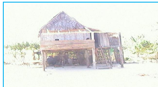
Gambar 1. Pemukiman Terpinggirkan Di Kota Kendari

Kelompok sosial terpinggirkan atau lebih tepatnya kelompok sosial marjinal yaitu kelompok sosial yang menjadi bagian dari dua budaya atau dua masyarakat, tetapi tidak termasuk secara penuh (utuh) pada salah satu budaya atau masyarakat tersebut (bandingkan, Horton & Hunt, 1993:402). Tidak tersentuhnya kelompok sosial terpinggirkan dari program pembangunan fasilitas kota, juga disebabkan oleh karena mereka tinggal di wilayah kota yang terpinggirkan, yang tidak mesti harus terletak dipinggiran kota, tetapi bisa jadi dekat dengan pusat kota.