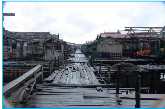
Gambar 5. Dampak Negatif Kesemrawutan Permukiman Terpinggirkan Di Kecamatan Kendari

hujan; 7 % sudah biasa; dan 5 % tidak senang karena di lingkungannya sering terjadi tindakan kriminal.