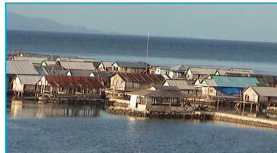
Gambar 6. Solusi Dampak Negatif Kesemrawutan Permukiman Terpinggirkan Di Kecamatan Kendari

Dalam penataan arsitektur permukiman kumuh bagi masyarakat yang modal sosial rendah, tidak mungkin mengharapkan datangnya inisiatif dari pihak mereka sendiri. Karena itu, dibutuhkan peran pihak ketiga dalam hal ini dinas pemerintah terkait, dengan melibatkan lembaga-lembaga swadaya masyarakat yang memahami kompleksitas masalah permukiman kumuh, bukan saja dari segi teknis-teknologis tetapi terutama dari segi sosial-budayanya. Sebaliknya, perencanaan penataan arsitektur di permukiman kumuh kota, tidak bisa hanya dari satu arah oleh pihak/penguasa saja, tetapi harus bersifat timbale balik, dengan melibatkan semua pihak, termasuk masyarakat di permukiman kumuh sebagai subjek utama. Minimal penguasa memperhatikan aspirasi dan masukan dari mereka, karena mereka yang akan hidup di sana dan mereka lebih tahu kebutuhan mereka sendiri tentang fungsi guna ruang, serta lebih faham kondisi lingkungannya. Penentu kebijaksanaan hanya wajib memberi pengarah teknik penataan ke arah yang lebih baik dan manusiawi, membantu