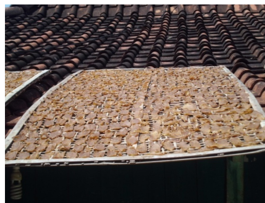
Gambar 1. Proses Pengeringan Kerupuk di UMKM Ibu Muayanah