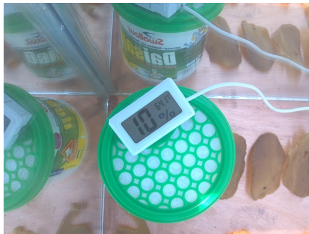
Gambar 5. Absorben Penyerap Lembab

Pengukuran kelembaban pula dilakukan bersamaan dengan pengukuran suhu agar dapat diketahui kemampuan alat dalam menyerap kelembaban yang dapat mempengaruhi proses pengeringan. Kelembaban dijaga agar selalu stabil untuk mengimbangi kecepatan penguapan sehingga menggunakan absorben yang terbuat dari bahan bambu maupun silica seperti yang ditunjukkan pada gambar 5.