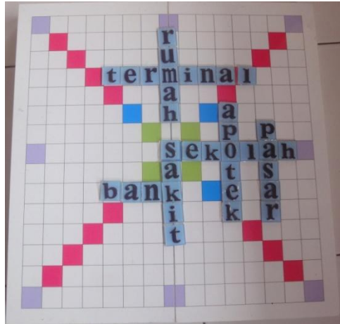
Gambar 1. Permainan Scrabble yang telah dimodifikasi

Permainan scrabble diberikan secara berkala yakni selama tujuh kali (hari) permainan. Pada permainan scrabble ini terdiri dari dua bagian. Pada bagian pertama, subjek diminta untuk menyusun kata berdasarkan kata kunci atau tema yang telah ditentukan. Setelah kata tersusun pada papan scrabble subjek diminta untuk membaca dan menuliskannya pada buku subjek. Pada bagian kedua, subjek diminta untuk menyimak eksperimenter yang sedang membacakan sebuah teks. Saat menyimak, subjek diminta untuk menyalin kata atau kalimat yang subjek dengar pada buku tulis. Setelah subjek selesai menyimak dan menyalin, subjek diminta untuk menyebutkan beberapa kata yang telah dituliskannya dan menyusunnya pada papan scrabble . Kata yang telah disusun oleh subjek kemudian dibacanya kembali. Setiap bagian permainan subjek diminta untuk menyebutkan maksimal delapan kata sehingga jumlah total dari kedua bagian permainan adalah 16 kata. Setiap sesi atau pertemuan eksperimenter memberikan kata kunci (tema) atau teks yang berbeda.