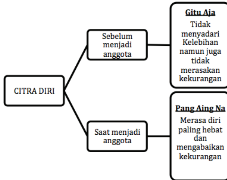
Gambar 3 Citra diri anggota geng motor sebelum dan saat menjadi anggota geng motor

gin terlihat lebih baik. Meskipun memang tidak ada “masalah” dalam keluarga mereka. Dalam artian tak satupun dari mereka berasal dari keluarga “ broken home ”.