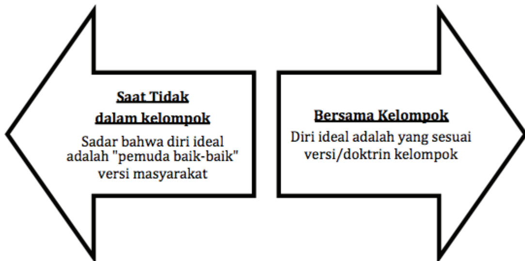
Gambar 4 Pandangan akan diri yang ideal

lontar juga jawaban kalau sosok diri yang ideal adalah “pemuda baik-baik” versi masyarakat.