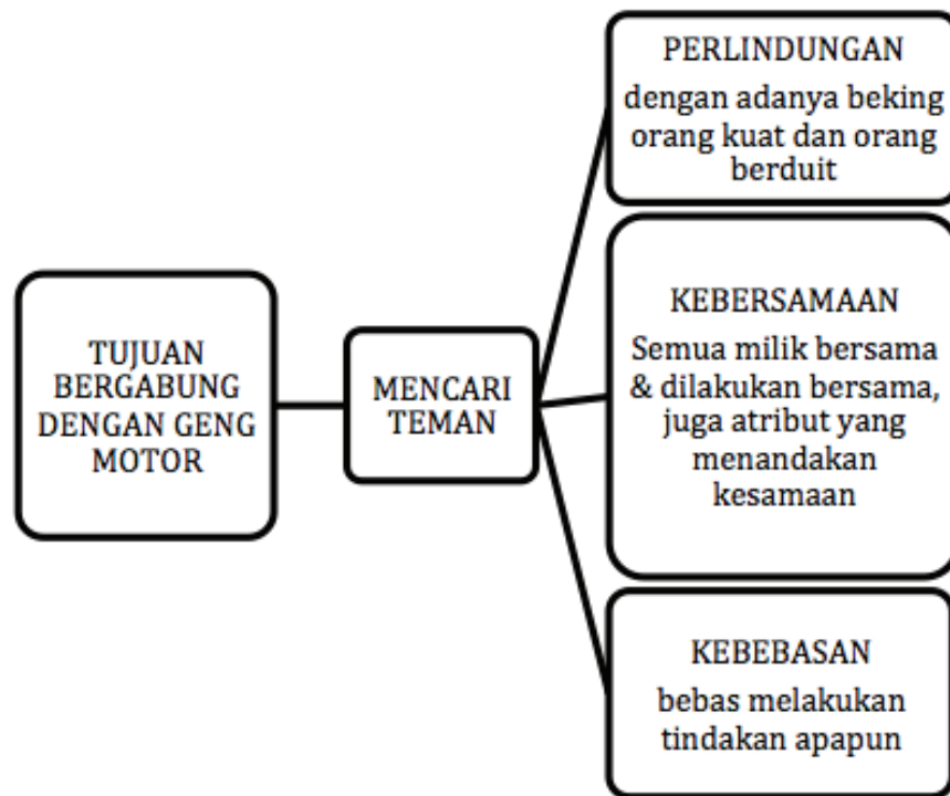
Gambar 2 Tujuan bergabung dengan geng motor

karena mereka merasa punya beking ( backing ). Walaupun begitu, adakalanya mereka merasa takut jika sedang sendirian.