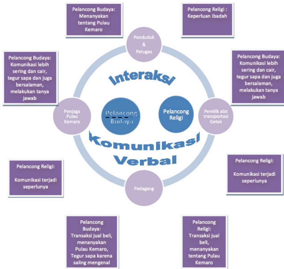
Gambar 8. 4 Model Perilaku Komunikasi Pelancong di Pariwisata Pulau Kemaro

menyenangkan dan santai. Komunikasi interpersonal melalui interaksi yang berlangsung diantara sesama pengunjung atau diantara pengunjung dengan pelaku wisata disesuaikan dengan kondisi kepentingan yang dirasakan.