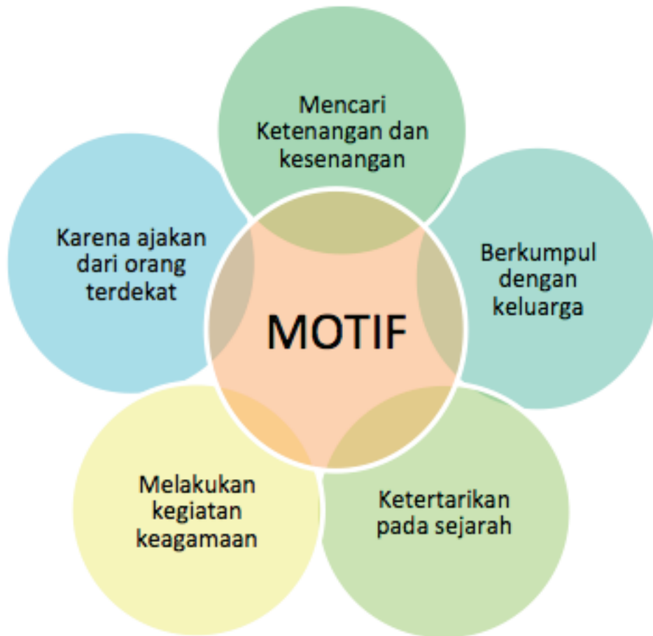
Gambar 8. 3 Motif Pelancong datang ke Pariwisata Pulau Kemaro