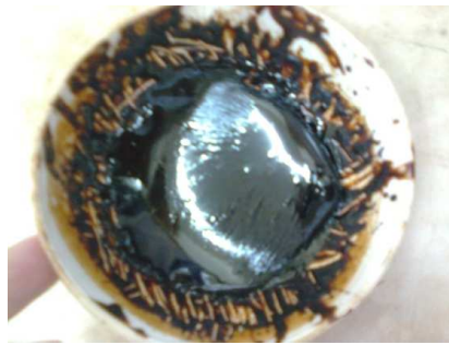
Gambar 2. Ekstrak kental gambir.