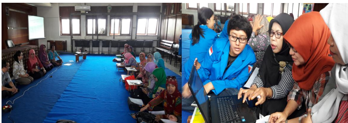
Gambar 1 : Ibu Sekel Grogol Selatan, Kebayoran Lama membuka acara kegiatan P2M Pengenalan dan Pelatihan Internet pada Guru-guru PAUD di kelurahan Grogol Selatan

Cookies: Makin banyak informasi yang ditampilkan diinternet yang tanpa kita sadari membuka peluang penyalahgunaan oleh pihak – pihak tidak berwenang , contoh : account yang kita miliki di situs jejaring social seperti facebook, friendster, twitter,Instagram, Paht, Line, WA. dll .