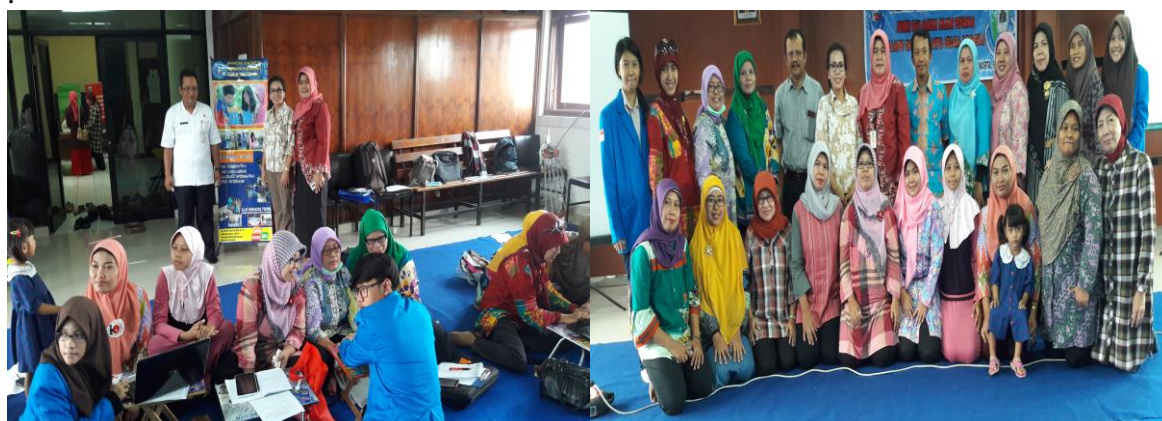
Gambar 2. Pak Lurah meninjau kegiatan P2M dan Foto bersama setelah kegiatan P2M selesai.