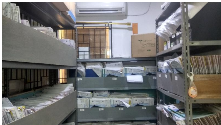
Gambar 3.1 Ruang Penyimpanan Berkas Rekam Medis