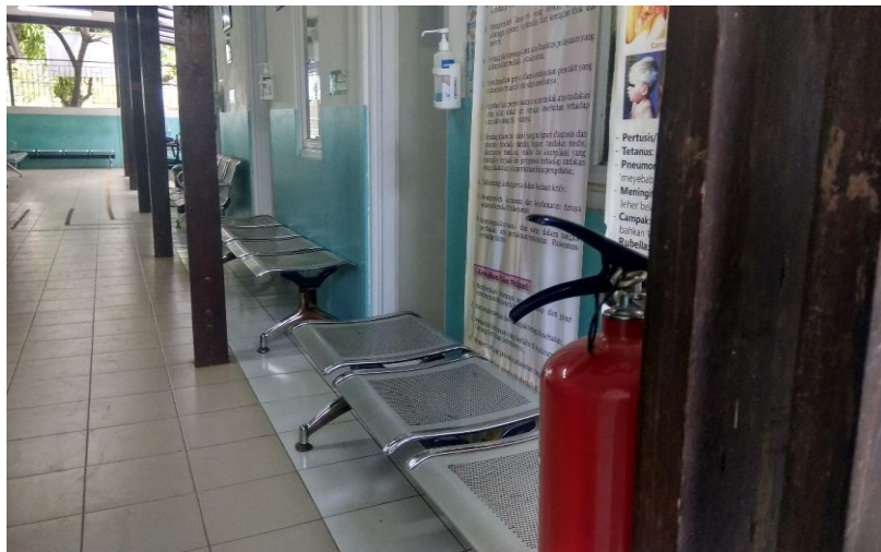
Gambar 3.4 Lokasi APAR Ke-1 di Kramatwatu Serang

“Ada, ada APAR di Puskesmas jumlahnya 2 hanya ada di sentral : 1 dekat poli dan 1 dekat apotek untuk khusus ruangan penyimpanan tidak ada”.