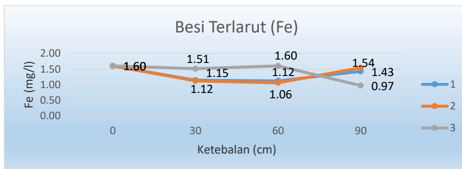
Gambar 1. Grafik Hasil Proses Filtrasi Besi (Fe)

Hasil penelitian yang dilakukan sebanyak 2 \times 3 \times 3 = 18 kali percobaan perlakuan Filtrasi dengan ketebalan dimulai dari 30, 60 dan 90 cm. Parameter yang diukur dalam Filtrasi ini adalah perubahan Kandungan Mangan (Mn) dan Besi (Fe). perubahan yang terjadi akibat filtrasi ini tabel 1 dan gambar 1,2 dan 3. Dan Berdasarkan grafik diatas bahwa waktu berpengaruh terhadap penurunan kadar Fe dalam air tanah dengan menggunakan aerasi Hasil laboratorium perubahan yang terjadi akibat Filtrasi ini adalah sebagai berikut :