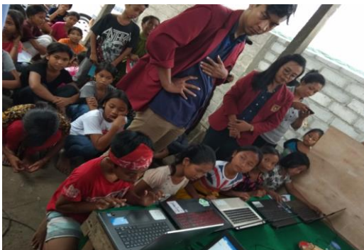
Gambar 6. Persiapan Pelatihan Microsoft Word

Kegiatan ini dibuatkan modul komputer yang materinya merujuk kepada modul pelatihan komputer kursus komputer untuk sekolah dasar (Academia, 2017). Dalam penyampaian materi diselingi dengan kuis berhadiah, dan anak-anak cukup berani maju tampil ke depan untuk menjawab pertanyaan, yang jika berhasil menjawab pertanyaan mendapatkan hadiah. Setelah penyampaian materi belajar mengetik dengan Microsoft Word dari modul yang dibuat, merujuk kepada modul pelatihan Microsoft Word untuk anak-anak sekolah dasar (Komputer, 2016), dilanjutkan dengan praktek pelatihan Microsoft Word yang dilakukan dengan mengetikkan beberapa baris kalimat dan dilakukan secara bergiliran. Semua peserta mendapatkan giliran dalam pelatihan tersebut.