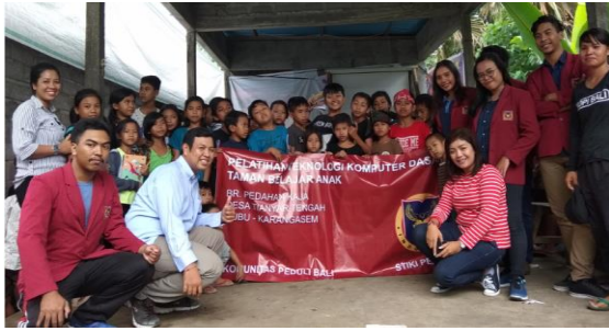
Gambar 9. Penutupan dengan Foto Bersama