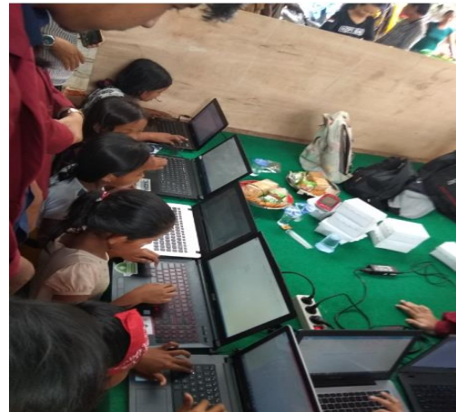
Gambar 7. Pelatihan Microsoft Word Untuk Anak-Anak

Setelah semua mendapatkan pelatihan, kegiatan diselingi dengan memberikan kuis hadiah. Ada beberapa siswa yang maju untuk menjawab namun beberapa siswa tidak dapat menjawab dengan tepat, akhirnya terdapat siswa yang dapat menjawab dengan tepat sehingga mendapatkan hadiah. Kemudian terdapat penyerahan sertifikat/piagam pelatihan dan penyerahan modul pelatihan komputer kepada guru pengampu Taman Belajar, dengan harapan agar guru dapat mendampingi siswa dalam berlatih lagi untuk meningkatkan kemampuan komputernya melalui modul pelatihan tersebut.