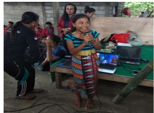
Gambar 3. Menyanyi Lagu Anak-Anak

Pada saat acara berlangsung, anak-anak antusias mengikuti pelatihan ini, materi yang disajikan tidak membosankan diselingi dengan kuis berhadiah. Materi teknologi komputer diisi dengan pengenalan komponen sistem komputer yaitu komponen perangkat keras, perangkat lunak dan komponen pengguna komputer.