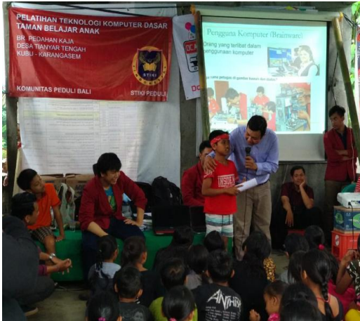
Gambar 5. Acara Kuis Berhadiah

Kegiatan ini dibuatkan modul komputer yang materinya merujuk kepada modul pelatihan komputer kursus komputer untuk sekolah dasar (Academia, 2017). Dalam penyampaian materi diselingi dengan kuis berhadiah, dan anak-anak cukup berani maju tampil ke depan untuk menjawab pertanyaan, yang jika berhasil menjawab pertanyaan mendapatkan hadiah. Setelah penyampaian materi belajar mengetik dengan Microsoft Word dari modul yang dibuat, merujuk kepada modul pelatihan Microsoft Word untuk anak-anak sekolah dasar (Komputer, 2016), dilanjutkan dengan praktek pelatihan Microsoft Word yang dilakukan dengan mengetikkan beberapa baris kalimat dan dilakukan secara bergiliran. Semua peserta mendapatkan giliran dalam pelatihan tersebut.