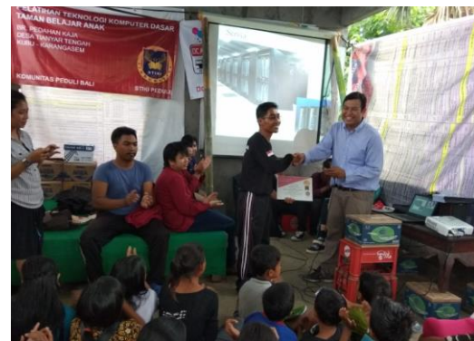
Gambar 8. Penyerahan Piagam Pelatihan Kepada Taman Belajar

Setelah semua mendapatkan pelatihan, kegiatan diselingi dengan memberikan kuis hadiah. Ada beberapa siswa yang maju untuk menjawab namun beberapa siswa tidak dapat menjawab dengan tepat, akhirnya terdapat siswa yang dapat menjawab dengan tepat sehingga mendapatkan hadiah. Kemudian terdapat penyerahan sertifikat/piagam pelatihan dan penyerahan modul pelatihan komputer kepada guru pengampu Taman Belajar, dengan harapan agar guru dapat mendampingi siswa dalam berlatih lagi untuk meningkatkan kemampuan komputernya melalui modul pelatihan tersebut.