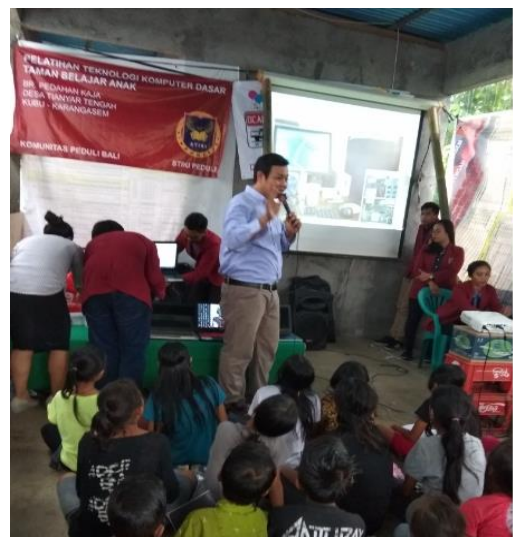
Gambar 4. Presentasi Teknologi Komputer

Pada saat acara berlangsung, anak-anak antusias mengikuti pelatihan ini, materi yang disajikan tidak membosankan diselingi dengan kuis berhadiah. Materi teknologi komputer diisi dengan pengenalan komponen sistem komputer yaitu komponen perangkat keras, perangkat lunak dan komponen pengguna komputer.