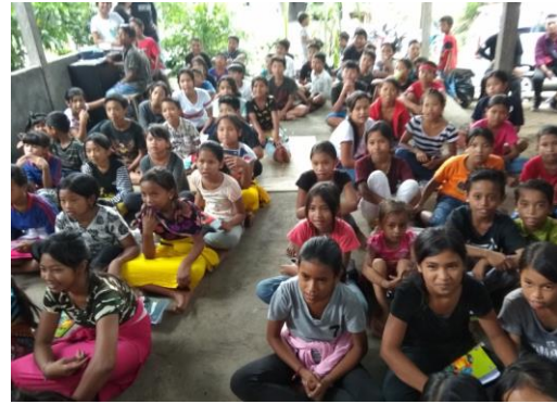
Gambar 2. Anak-anak Peserta Pelatihan

Kegiatan pelatihan diawali dengan kegiatan persiapan yang terdiri dari persiapan lokasi pelatihan, LCD proyektor, pemasangan spanduk. Persiapan perangkat laptop untuk pelatihan, dan sound system . Acara diawali dengan perkenalan tim pengabdian dari Sekolah Tinggi Ilmu Komputer Indonesia yang diikuti oleh 2 dosen dan 5 orang mahasiswa. Karena situasinya cukup panas dan anak-anak terlihat bosan, maka kegiatan dimulai dengan menyanyikan lagu anak-anak, untuk menghilangkan rasa bosan anak-anak. Dilanjutkan dengan pemberian materi teknologi komputer terkini untuk anak-anak.