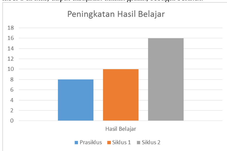
Gambar 2. Data Hasil Belajar Peserta Didik

Berdasarkan tabel 1 di atas, dapat disajikan dalam grafik, sebagai berikut: