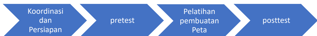
Gambar 1. Alur Kegiatan

Kegiatan pelatihan pembuatan peta sebaran penyakit bagi petugas Bidang Pengendalian dan Pemberantasan Penyakit (P2P) dilaksanakan di Aula Dinas Kesehatan Provinsi Jambi. Pelaksanaan dilakukan selama 2 hari. Sasaran kegiatan adalah petugas bidang P2P Dinas Kesehatan Provinsi Jambi yang berjumlah 16 orang. Kegiatan pelatihan pembuatan peta sebaran penyakit dilakukan dengan tahapan pelaksanaan sebagai berikut: