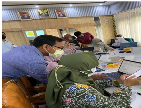
Gambar 4. Aktivitas memantau proses praktek membuat peta sebaran penyakit