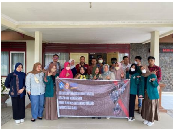
Gambar 3. Foto bersama dosen, pemateri, mahasiswa dan peserta usai pelatihan

Kegiatan pelatihan membuat peta sebaran penyakit dilakukan dengan metode simulasi dan praktek langsung yang juga turut dibantu oleh lima orang mahasiswa. Mahasiswa yang ambil bagian dalam kegiatan ini adalah mahasiswa yang sudah mempunyai dasar penguasaan aplikasi QGIS. Berikut adalah foto pada saat pelatihan berlangsung: