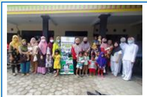
Gambar 4.2 Dokumentasi hasil evaluasi edukasi tentang faktor-faktor risiko kejadian stunting.