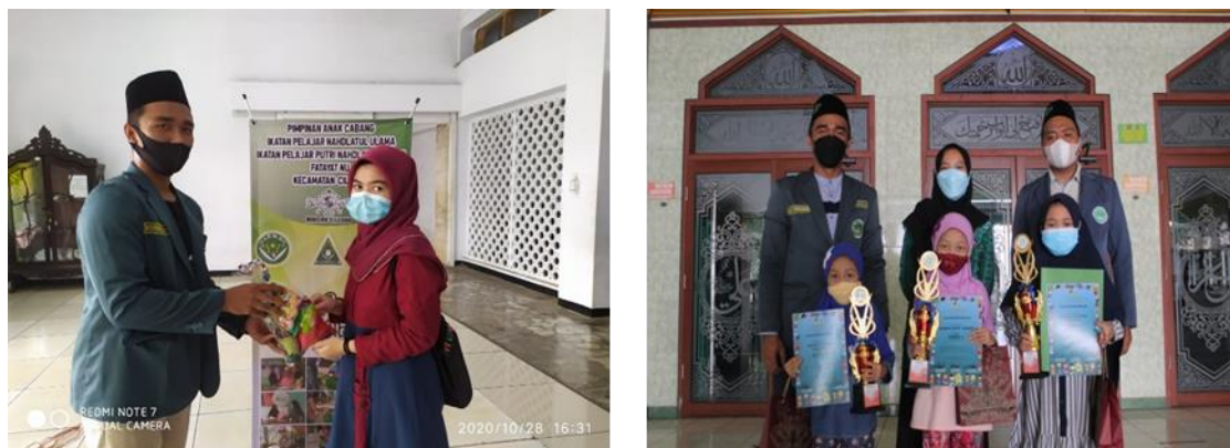
Gambar 3. Menunjukkan Organisasi Ikatan Pelajar Nahdatul Ulama sedang melakukan kegiatan “Berbagi kepada Sesama” dan juga melakukan kegiatan lomba-lomba yang diperuntukkan untuk anak-anak

Organisasi Ikatan Pelajar Nahdatul Ulama (IPNU) Ciledug terus berusaha untuk mendapatkan dukungan masyarakat dan mencari kader untuk meneruskan generasi Nahdatul Ulama terkait eksistensinya, sehingga kegiatan/program yang dilakukan dapat memberikan dampak positif terhadap para kader dan masyarakat sekitar pada umumnya.