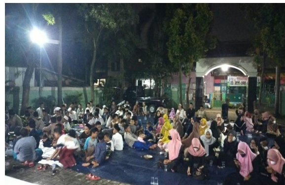
Gambar 1. Menunjukkan Organisasi Ikatan Pelajar Nahdhatul Ulama sedang melakukan kegiatan “Rismada Bersholawat” yang bertempat di Masjid Jami’ Raudhatul Huda, Paninggilan Utara.