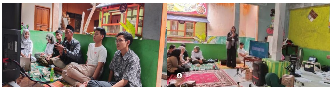
Gambar 2. Menunjukkan antusiasme peserta dalam hal ini para anggota Ikatan Pelajar Nadhatul Ulama yang memberikan pertanyaan kepada narasumber mengenai materi dan tugas praktek yang diberikan