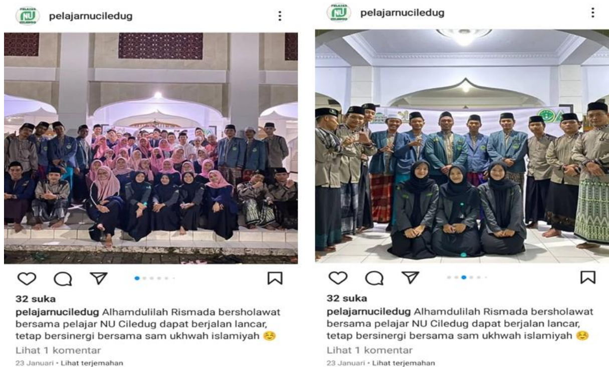
Gambar 3. Menunjukkan hasil publikasi pada media sosial Instagram @pelajarnuciledug yang sudah dipraktekkan oleh para peserta (anggota Ikatan Pelajar Nadhatul Ulama)

Dari kegiatan Pengabdian Kepada Masyarakat yang sudah dilakukan, maka hasilnya dapat disampaikan sebagai berikut: