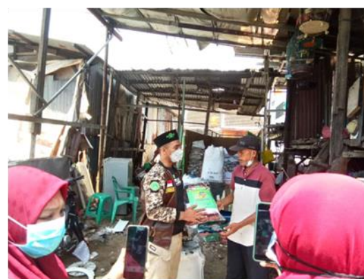
Gambar 2, Menunjukkan Organisasi Ikatan Pelajar Nahdhatul Ulama sedang melakukan kegiatan donor darah, dan pemberian Sembako kepada masyarakat sekitar