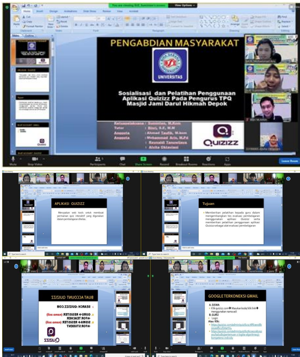
Gambar 5. Penyampain modul materi penggunaan aplikasi Quizizz .

Aplikasi Quizizz merupakan salah satu media evaluasi secara online yang dapat dimanfaatkan oleh Guru dan pengurus TPQ dengan cara mengikuti Sosialisasi dan Pelatihan Penggunaan Aplikasi Quizizz Pada Pengurus TPQ Masjid Jami Darul Hikmah Depok dalam meningkatkan kompetensi dan skills guru dalam melakukan evaluasi siswa baik proses pembelajaran dilakukan secara daring maupun luring, melalui kegiatan pengabdian masyarakat yang diselenggarakan Universitas Bina Sarana Informatika.