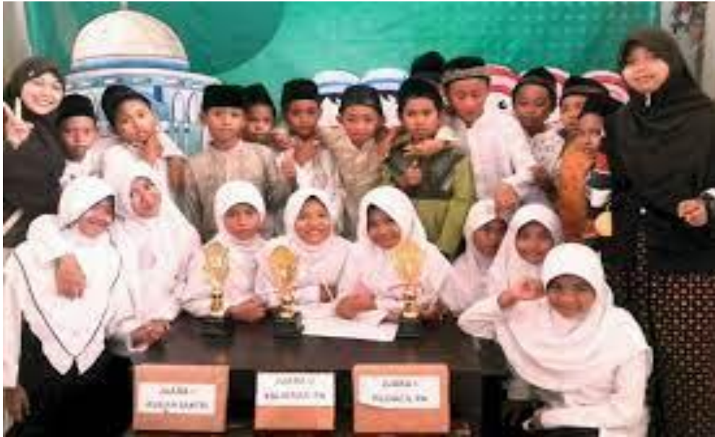
Gambar 3. Kegiatan Lomba baca Al Quran

Sumber daya pengajar di TPQ adalah guru dari MIS Raudhatul Athfal dan masyarakat sekitar yang memiliki kompetensi membaca dan menulis Al-Quran. Kegiatan di TPQ Darul Hikmah bersifat home schooling. Para siswa akan belajar cara membaca Al-Qur'an dengan tartil, menulis Al-Qur'an, hafalan surat-surat pendek dan doa harian. Kegiatan operasional TPQ Darul Hikmah dilaksanakan di lingkungan Masjid Jami' Darul Hikmah. Saat ini peserta belajar di TPQ Darul Hikmah kurang lebih 30 siswa. Kegiatan belajar mengajar dilaksanakan setiap hari kecuali hari Minggu dengan jam belajar mulai dari jam 15:30 sampai dengan 17:00. Tetapi sejak terjadinya pandemi Covid-19 bulan Maret 2021, proses belajar tidak dilaksanakan karena untuk memutus penyebaran virus tersebut.