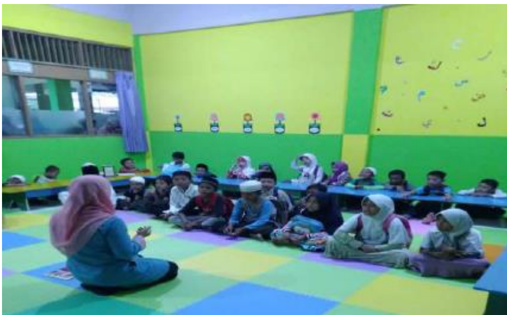
Gambar 4. Kegiatan Belajar Hafalan Doa

TPQ Darul Hikmah berada di lingkungan yang memiliki potensi untuk mewujudkan pendidikan dari, oleh dan untuk masyarakat. Penguatan pengolahan TPQ yang integratif (Malik, 2013) menjadi sangat penting terutama di era revolusi industri 4.0. TPQ Darul Hikmah dapat memanfaatkan teknologi informasi untuk pembelajaran maupun operasional sehari-hari. Dengan pengelolaan yang baik, TPQ Darul Hikmah mampu menjadi Taman Pendidikan Alqur'an yang mendapat pengakuan unggul oleh masyarakat maupun pemerintah.