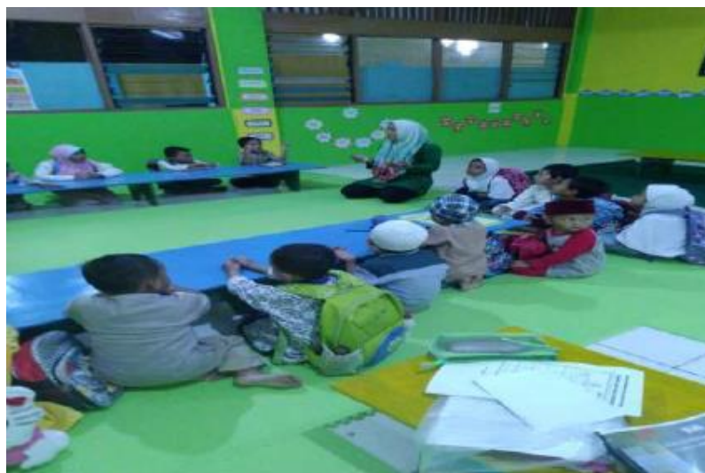
Gambar 2. Kegiatan Belajar siswa

TPQ ini terletak Jl. H. Terin RT. 006/03 Kel. Pangkalan Jati Baru Depok Jawa Barat Jumlah kader dan anggota yang ada yaitu kurang lebih 20 orang. TPQ Darul Hikmah berada lingkungan Masjid Jami' Darul Hikmah Kelurahan Pangkalan Jati Kecamatan Cinere Kota Depok. TPQ ini didirikan Dewan Kemakmuran Masjid Jami' Darul Hikmah pada tahun 2019 dengan visi menyiapkan generasi Qurani yang berlandaskan ahli Sunnah Wal Jamaah. Struktur organisasi TPQ Darul Hikmah berada di bawah naungan Yayasan Darul Hikmah. Pengelolaan TPQ Darul hikmah secara sukarelawan oleh warga masyarakat di sekitar Masjid Jami' Darul Hikmah. Susunan pengurus TPQ Darul Hikmah terdiri dari ketua, wakil ketua, sekretaris, dan pengajar.