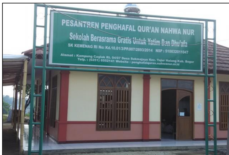
Gambar 1. Pesantren Penghafal Qur'an Nahwa Nur

Beberapa pertimbangan dasar dari Yayasan dalam mendirikan PPQ Nahwa Nur ini adalah sarana pendidikan untuk kalangan bawah (yatim dan dhu'afa) kurang merata yang sejatinya ini merupakan hak bagi setiap umat, banyaknya respon masyarakat terhadap upaya mencetak generasi yang berguna bagi agama, masyarakat, dan negara khususnya para penghafal Al-Qur'an, kesadaran masyarakat dalam penyaluran sedekah yang tepat dan akurat, yakni menciptakan sarana pendidikan bagi yatim dan dhu'afa untuk menjadi generasi Qur'ani dan masyarakat membutuhkan adanya lembaga penghafal Al-Qur'an yang berakhlak Qur'ani.