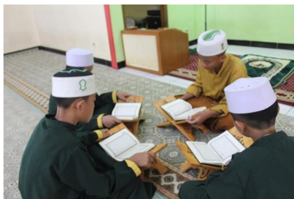
Gambar 2. Proses belajar dengan menggunakan kurikulum pesantren dan kurikulum Diknas dan Santri melakukan Murojaah Hafalan