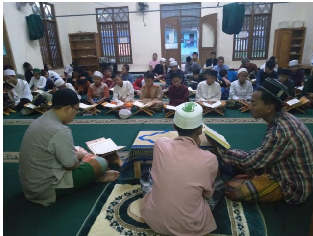
Gambar 4. Santri Melakukan Khatam Qur'an

Semua santri PPQ Nahwa Nur selalu mengupgrade ilmu pengetahuan terutama mengenai perkembangan teknologi informasi. Seiring dengan perkembangan teknologi informasi ini, para santri membutuhkan pembelajaran dalam bentuk pelatihan maupun workshop mengenai desain menggunakan aplikasi photoshop. Aplikasi Photoshop itu sendiri dapat digunakan untuk berbagai hal dalam mendesain, seperti melakukan editing foto, membuat poster, mendesain baju, buku dan lain sebagainya (Anas et al., 2021). Tanpa kita sadari sekarang ini banyak ditemukan foto yang menarik bahkan unik dari hasil manipulasi yang dilakukan oleh orang-orang kreatif (Dewi et al., 2021). Maka dari itu, pihak PPQ Nahwa Nur merasa sangat perlu sekali pembelajaran dalam bidang desain, karena untuk mengasah kreatifitas para santri. Mereka dapat menyalurkan jiwa kreatifitasnya dalam bidang desain yang tentunya dapat memberikan manfaat yang sangat besar bagi diri para santri maupun bagi PPQ Nahwa Nur. Mengingat desain juga merupakan salah satu hasil dari pemikiran kreatif manusia (Syahrul & Palcomtech, 2019) Beberapa pelatihan yang mereka butuhkan dalam bidang desain ini antara lain : mengedit foto, membuat spanduk, membuat flyer kegiatan, membuat cover proposal kegiatan sampai dengan membuat desain untuk konten media sosial.