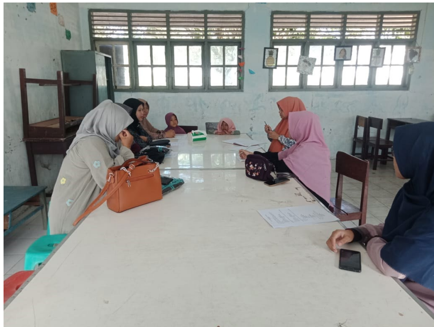
Gambar 2. Pemberian Materi Mengenai Ms. Word Terhadap Guru SD IT Al Alaq

Pada materi Ms Word akan dipelajari mengenai fungsi-fungsi icon pada Ms Word, cara pembuatan surat, cara penyusunan rencana pembelajaran yang baik, memberikan info mengenai tombol fungsi cepat pada Ms. Word, cara menyimpan hasil kerja.