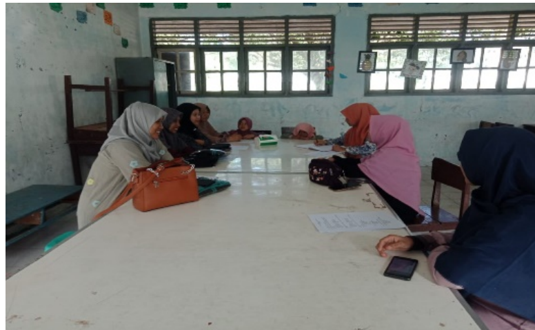
Gambar. 3. Pembahasan Materi Mengenai Ms. Excel terhadap Guru-Guru SD IT Al Alaq

Pembuatan sebuah presentasi yang menarik, akan menarik perhatian seorang siswa dalam melihat dan memahami materi terlebih pada anak-anak usia SD. Media pembelajaran yang menarik dan interaktif akan merangsang semangat belajar dan merangsang pola belajar siswa, sehingga informasi dari guru ke siswa dapat tersampaikan dengan baik dan benar. Sebuah presentasi memberikan pesan komunikasi yang baik.