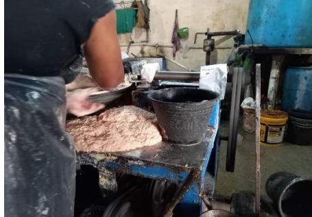
Gambar 3. Menunjukkan hasil dari penggilingan daging