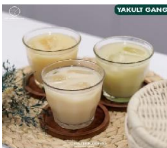
Gambar 4. Produk Sintesis Coffee