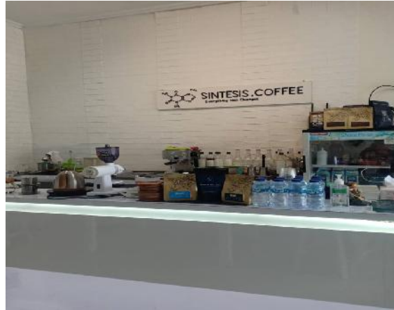
Gambar 1. Sintesis coffee