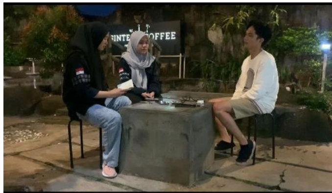
Gambar 2. Wawancara Bersama Penanggung Jawab Sintesis Coffee

Dan didapatkan juga tingkat kepuasan karyawan terhadap gaji yang mereka peroleh, cukup puas menjadi tingkatan bagi seluruh karyawan. Dapat dikatakan bahwa kompensasi memiliki pengaruh yang sangat signifikan terhadap kinerja karyawan. Para karyawan pun menyadari bahwa kompensasi yang mereka peroleh sesuai dengan tanggung jawab dan fleksibilitas waktu yang didapatkan. Kerena mereka tidak melakukan pekerjaan sepanjang waktu kerja seperti karyawan pabrik, mereka bebas melakukan kegiatan apa pun saat tidak melayani pelanggan tentu saja tanpa mengganggu pelanggan yang ada.