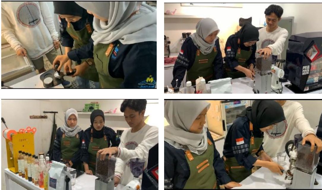
Gambar 3. Belajar Membuat Kopi