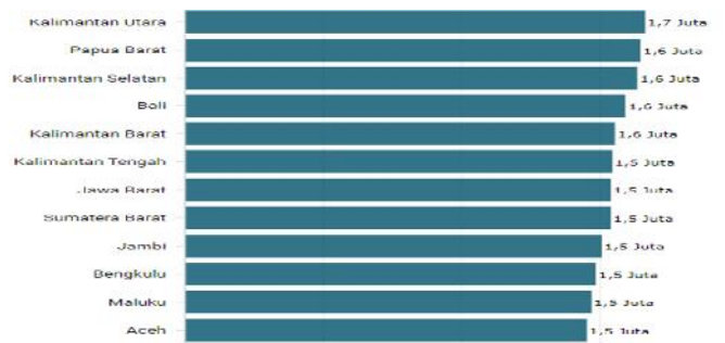
Diagram 1. Rata-rata Pengeluaran per Kapita Penduduk Perkotaan di 34 Provinsi Indonesia (2022)

Dari hasil kunjungan pun didapatkan data Tabel 1. Gaji dan Tingkat Kepuasan Terhadap Gaji, diketahui bahwa Sintesis Coffee memiliki 4 orang karyawan serta data gaji karyawan yang tentu saja sesuai dengan pernyataan bahwa kompensasi karyawan berada dibawah UMR Karawang, hal ini disesuaikan dengan pendapatan yang dihasilkan dari hasil penjualan yang rata – rata berada dikisaran 15 – 20 Juta. Meski terdapat larangan agar tidak membayar upah dibawah upah minimum, tetapi pelaku UMKM memiliki kelonggaran. Berdasarkan pernyataan dari Hukumonline.com pemberian upah UMKM harus ditetapkan berdasarkan apa yang telah disepakati antara pengusaha dan pekerja. Tetapi hal ini pun harus sesuai dengan ketentuan minimal 50% dari rata – rata konsumsi ditingkat provinsi Jawa Barat, serta banyaknya upah yang disepakati minimal 25% diatas garis kemiskinan tingkat provinsi Jawa Barat Pasal 36 ayat (2). (hukum online.com)