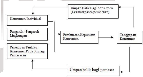
Gambar 1. Model Perilaku Konsumen

Perilaku konsumen yang dijabarkan dalam model perilaku oleh Assael (2001) menjelaskan bahwa perilaku konsumen dipengaruhi oleh individu itu sendiri, lingkungan dan bagaimana strategi pemasaran yang diterapkan oleh pemasar.