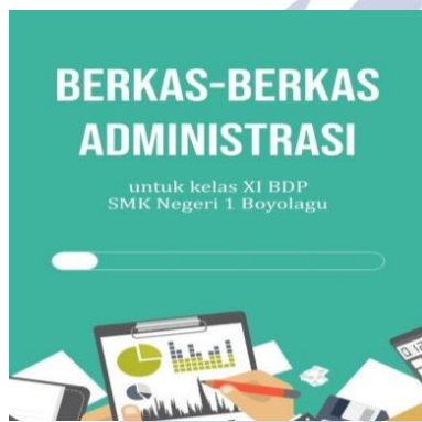
Gambar 2. Tampilan depan media

Rancangan dari keseluruhan media yang perlu dikerjakan sebelum dilakukan uji coba. Pada tahap ini, peneliti merancang produk awal.