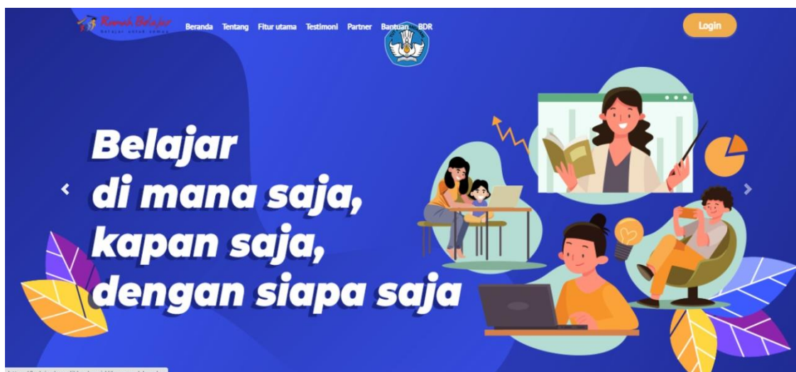
Gambar 3. Beranda Platform Rumah Belajar

Ternyata platform Rumah Belajar masih sering diakses oleh masyarakat Indonesia berdasarkan data dari Subregion. Para pengguna (guru/siswa) platform di Sumatera Utara terdapat sebanyak 34 provinsi di Indonesia, platform Rumah Belajar paling banyak digunakan dengan persentase, yaitu: Rumah Belajar (531%), Ruangguru (497%), Quipper (265%), Cisco Webex (110%), Zenius (97%) (Indriyani & Solihati, 2021). Artinya, guru dan siswa masih memanfaatkan platform Rumah Belajar sebagai sumber belajar digital dengan tujuan untuk meningkatkan kompetensi literasi.