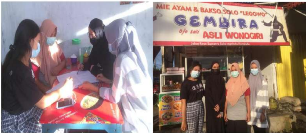
Gambar 2. Pendampingan Penyusunan Laporan Laba Rugi

Setelah melalui pelatihan dan pendampingan selama satu bulan, tim pengabdian melakukan evaluasi/assessment terhadap laporan keuangan yang 29 dibuat. Hasilnya laur biasa ternyata laporan keuangan laba rugi yang dibuat mitra suda 6 benar dan sesuai dengan standar SAK EMKM. Dimulai dari pencatatan transaksi, pengelompokan ke buku besar, neraca saldo, jurnal penyesuaian sampai dengan laporan laba rugi semuanya dikerjakan dengan baik dan benar oleh mitra.