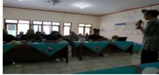
Gambar 1. Paparan materi pajak atas dana desa: PPh pasal 21, 22,23 dan PPN

Tahap selanjutnya adalah tahap evaluasi peserta sosialisasi yang dilakukan pada seluruh aparatur desa yang menjadi peserta sosialisasi. Evaluasi dilakukan dengan memberikan daftar pertanyaan yang sama seperti saat observasi dilakukan. Berdasar hasil sebelum dilakukan sosialisasi pertanyaan terkait pajak atas dana desa dan pajak atas pengadaan barang dan jasa pada khususnya mengalami kenaikan yang cukup tinggi dari 40% menjadi 84%. Demhan demikian terbukti bahwa sosialisasi berdampak signifikan dalam peningkatan pengetahuan aparatur desa terkait pajak dana desa. Sosialisasi yang dilakukan secara terus menerus akan dapat menghasilkan pemahaman yang tinggi terkait dengan penghitungan pajak dana desa serta pajak atas pengadaan barang dan jasa pada khususnya. Berikut adalah foto kegiatan yang dilakukan pada pelatihan pajak dana desa.