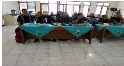
Gambar 2. Peserta mengikuti sosialisasi pajak