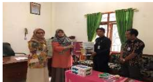
Gambar 4. Pemberian cenderamata pada Mitra PKM berbasis Riset