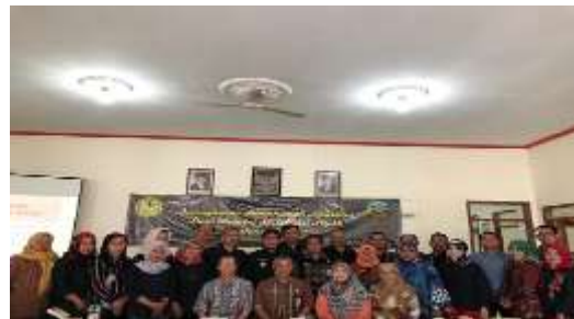
Gambar 3.Seluruh peserta sosialisasi pajak atas pengadaan barang dan jasa